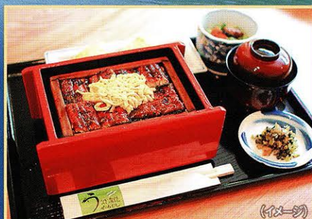
うなぎせいろ蒸し