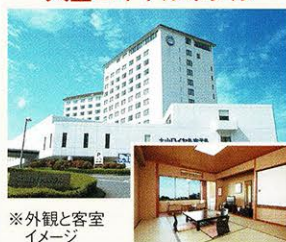
※外観と客室 イメージ