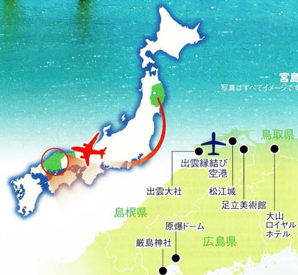
宮島 写真はすべてイメージです