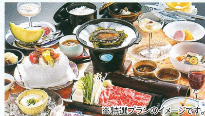
※特選プランのイメージです。

期間 / 2017年6月1日~2017年11月30日 ※7/30、8/6~8/19は除く。