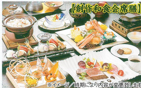
※イメージ / 時期により内容が変更致します

期間 / 2017年12月1日~2018年5月31日 ※2017年12/30~2018年1/3、2018年4/29~5/6は除く。