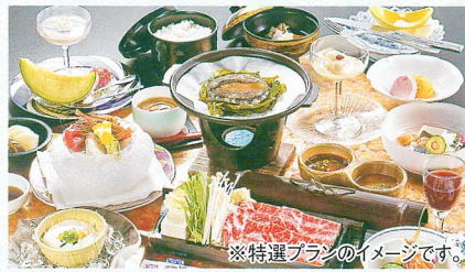
※特選プランのイメージです。