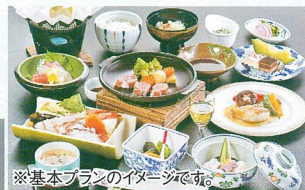
※基本プランのイメージです。